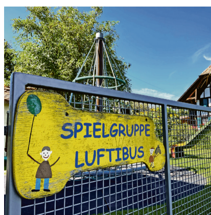
Der kleine, aber feine Aussenspielfeld lädt zum Austoben.

SALVENACH | Vor kurzem feierte der Verein Spielgruppe Luftibus sein 30-jähriges Bestehen mit einem Kindertheater. Die Spielgruppe in Salvenach betreut Kinder ab zwei Jahren bis zum Eintritt in den Kindergarten. Beim Besuch der Spielgruppe, die in zwei Altersgruppen geteilt ist, lernen die Kleinen, Kontakte mit gleichaltrigen Gspändlis zu knüpfen, sich in der Gemeinschaft einzufügen und sie geniessen viele gemeinsame Momente der Kreativität und des Spiels. Derzeit besuchen 36 Kinder die Spielgruppe, die seit gut zehn Jahren an der Hinteren Dorfstrasse 46 zu Hause ist. mkc Lesen Sie weiter auf Seite 3