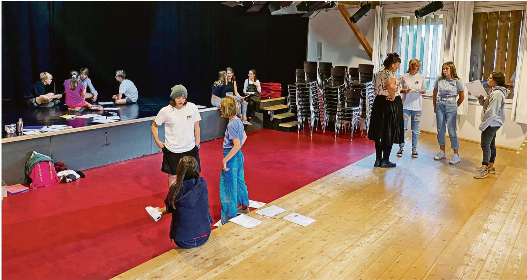
Rollengestaltung: Die Kinder und Jugendlichen entwickeln ihren Sprechtext anhand des Romans selber.

Die Werten Herren taufen ihre CD im KiB | Seite 5